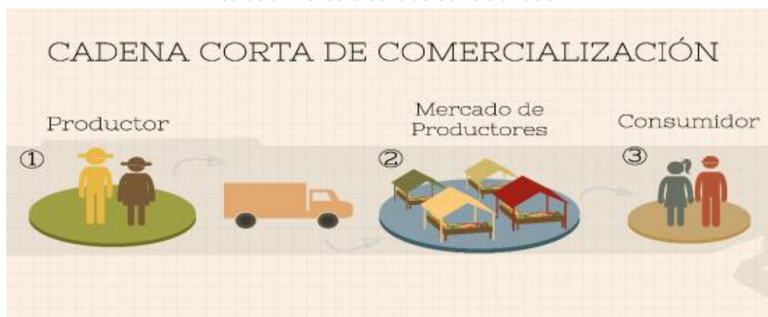
Ilustración 2 Circuito Corto de Comercialización 3

Según lo observado en recorrido de los circuitos, los consumidores, por lo general balancean tres factores para tomar decisiones respecto a sus compras; estas son, precio, calidad de los productos y cercanía al hogar del sitio de compra. En los estratos 1,2 y 3, prima el factor del precio, mientras en los demás, la calidad, es fundamental al momento de hacer la compra.